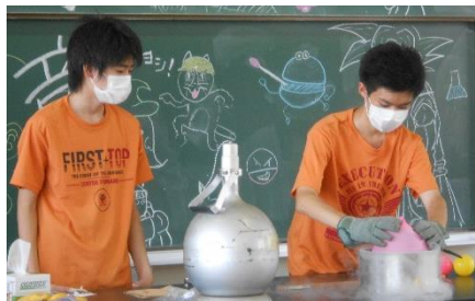
科学部実験ショー