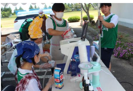
3年生による模擬店