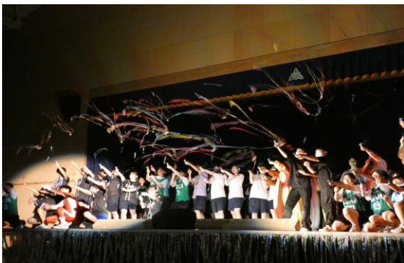
後夜祭フィナーレ

8月25日（金）、26日（土）に岩高祭が開催されました。入場制限のあった昨年までとは違い、4年ぶりに制限のない形で校内発表と一般公開が行われました。最後の岩高祭となる3年生はクラスでの模擬店や前夜祭、さらに後夜祭まで、企画・運営の中心となり学校を盛り上げていました。1・2年生もクラスの団結力を発揮して、すばらしい展示・発表で多くのみなさんから好評をいただきました。また新企画として地域の方のみなさんの展示や発表も行われました。