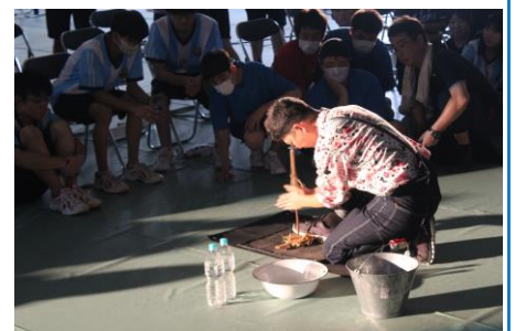
地域の方のみなさんの発表