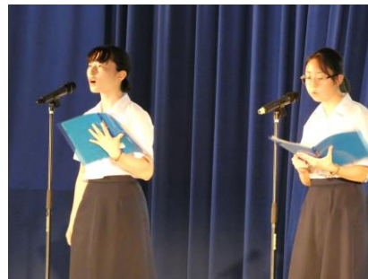
合唱部のステージ発表