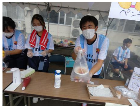
3年生による模擬店