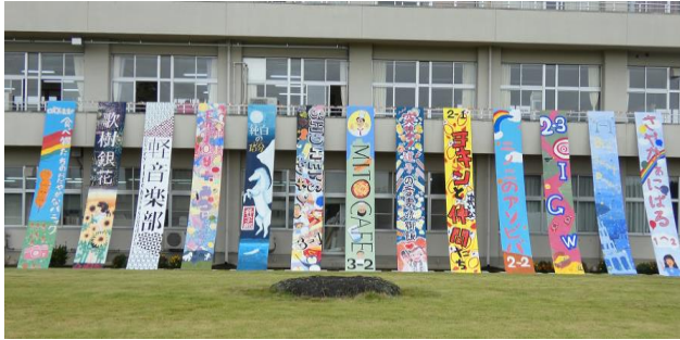
各団体による垂れ幕

8月26日（金）、27日（土）に岩高祭が開催されました。今年は同居家族2名までという限定はありましたが、3年ぶりに一般公開も行われました。コロナ対策を十分に行いながら、3年生による模擬店も開かれ活気ある行事となりました。また、JRC委員によるウクライナ支援の募金活動が行われ、27,500円の募金を頂きました。日本赤十字社を通して募金しました。ご協力ありがとうございました。