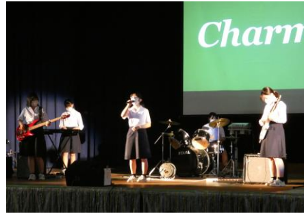
軽音楽部のステージ発表