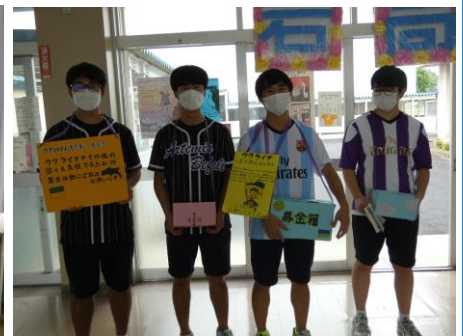
ウクライナ支援募金活動