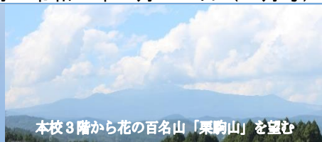
本校3階から花の百名山「栗駒山」を望む

宮城県岩ヶ崎高等学校（みやぎけんいわがさきこうとうがっこう） 〒989-5351 宮城県栗原市栗駒中野愛宕下1-3 TEL：0228-45-2266 FAX：0228-45-2267 Email：iwagasakikou@od.myswan.ed.jp HP：https://iwagasakikou.myswan.ed.jp